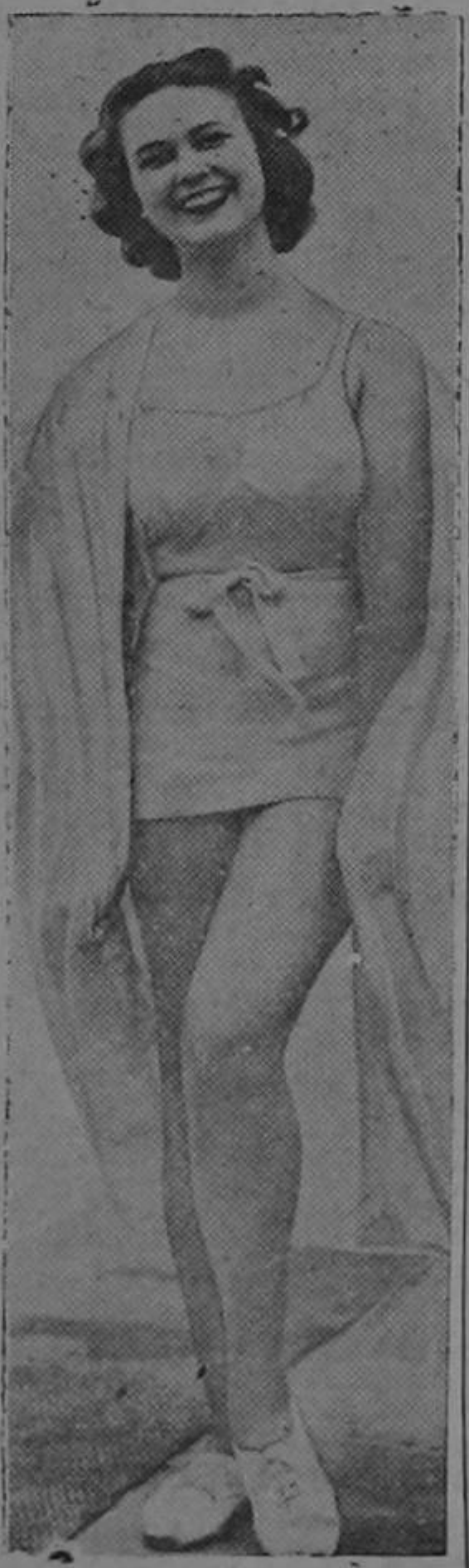
¡Agítese antes de usarse!