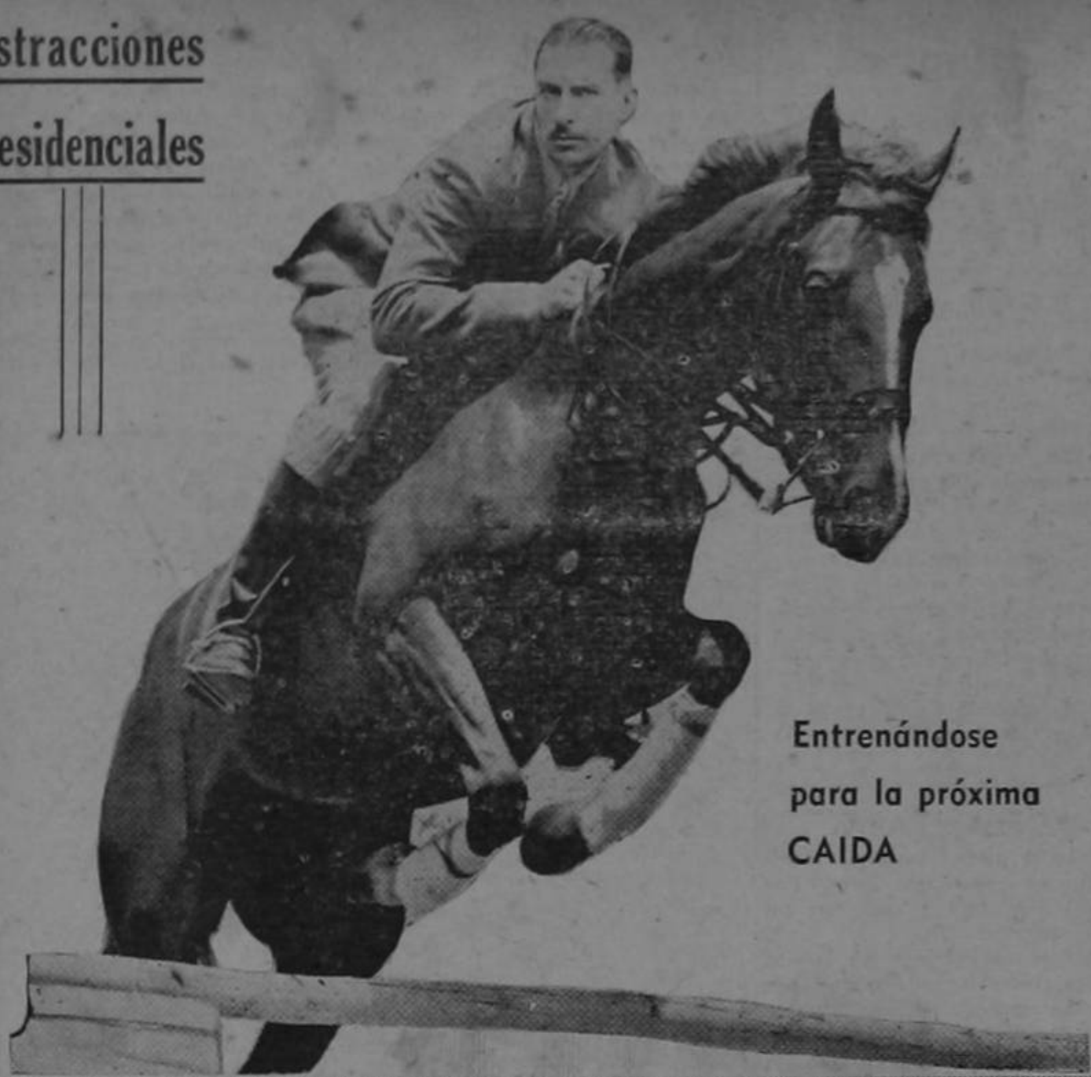
Entrenándose para la próxima CAIDA