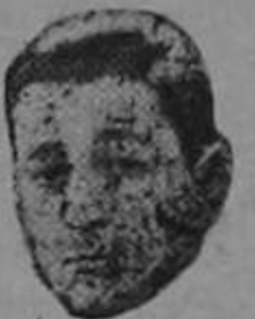
(EL INCOMPRENDIDO Y ROMANTICO POETA)

—No,— contesta Fritz —, pero mi primo tiene buena letra.