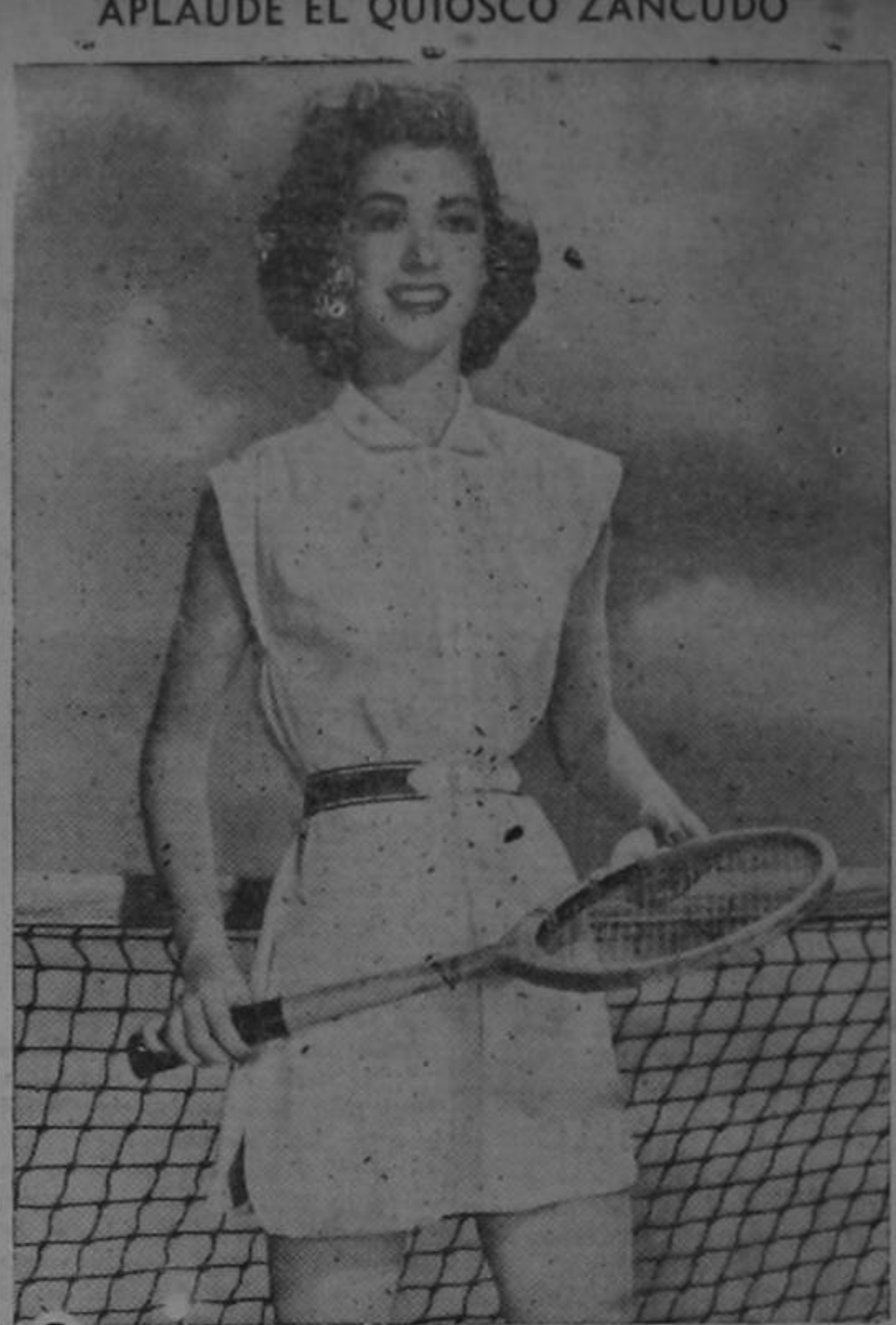
Este piloncito nos hace una pregunta que no podemos contestarle: ¿Cuánto salió costando el quiosco del Parque Central?