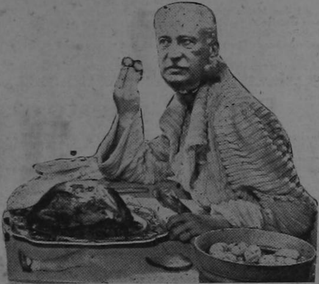
Rehuso méritos en Costa Rica. Vengan méritos de afuera. ¡Ven mérito de Franco...!