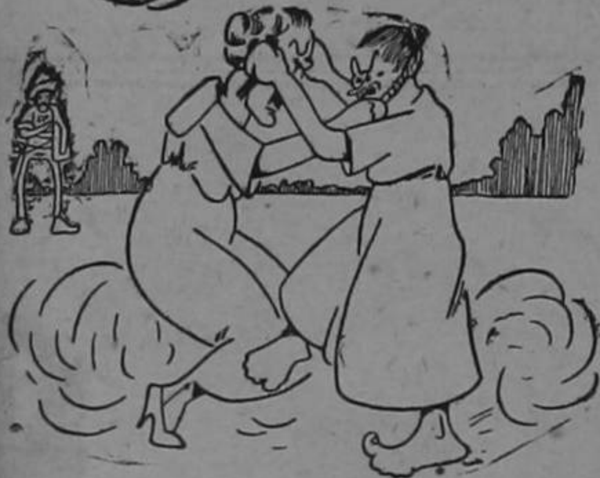
Veremos a nuestras damas probando que se saben amarrar las enaguas